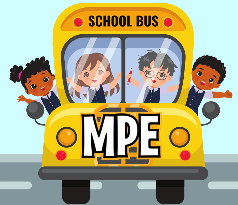
RUTA DEL AUTOBÚS MEMORIAL PARKWAY (MPE)