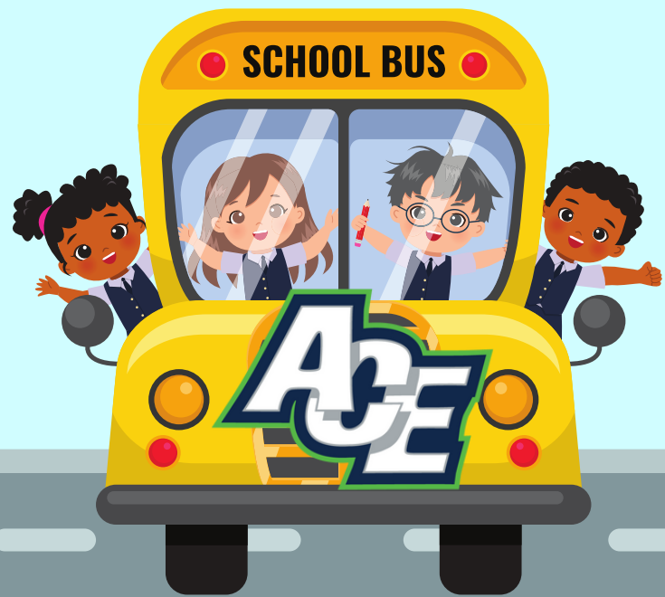
RUTA DEL AUTOBÚS CAMPBELL (ACE)

Todos los estudiantes necesitarán su identificación de la escuela de verano y la tarjeta "Smart tag" para poder tomar el autobús todos los días desde su escuela primaria hasta su escuela asignada en KSAT.