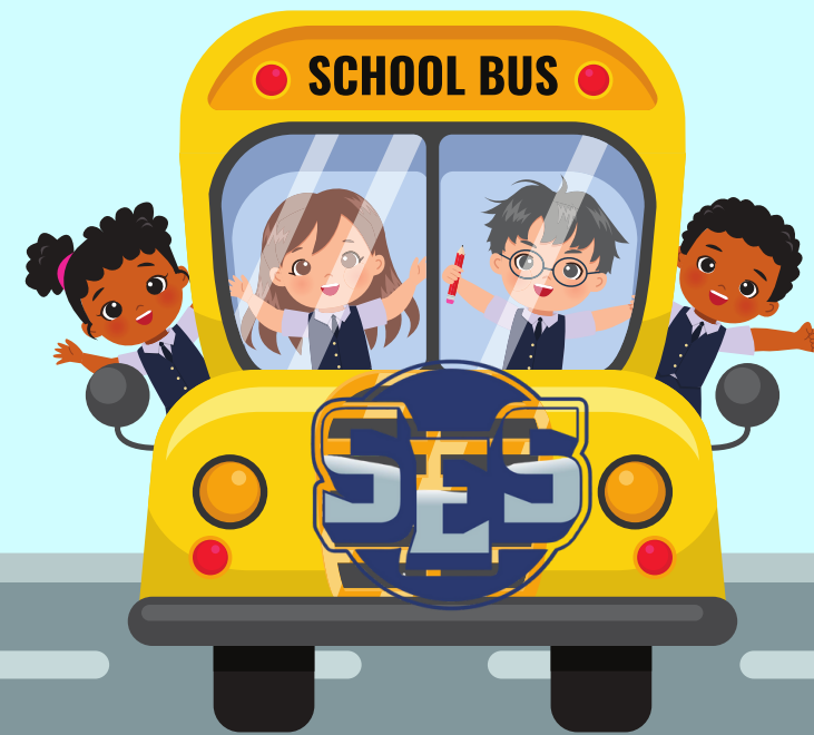
RUTA DEL AUTOBÚS ESCALERA (SES)